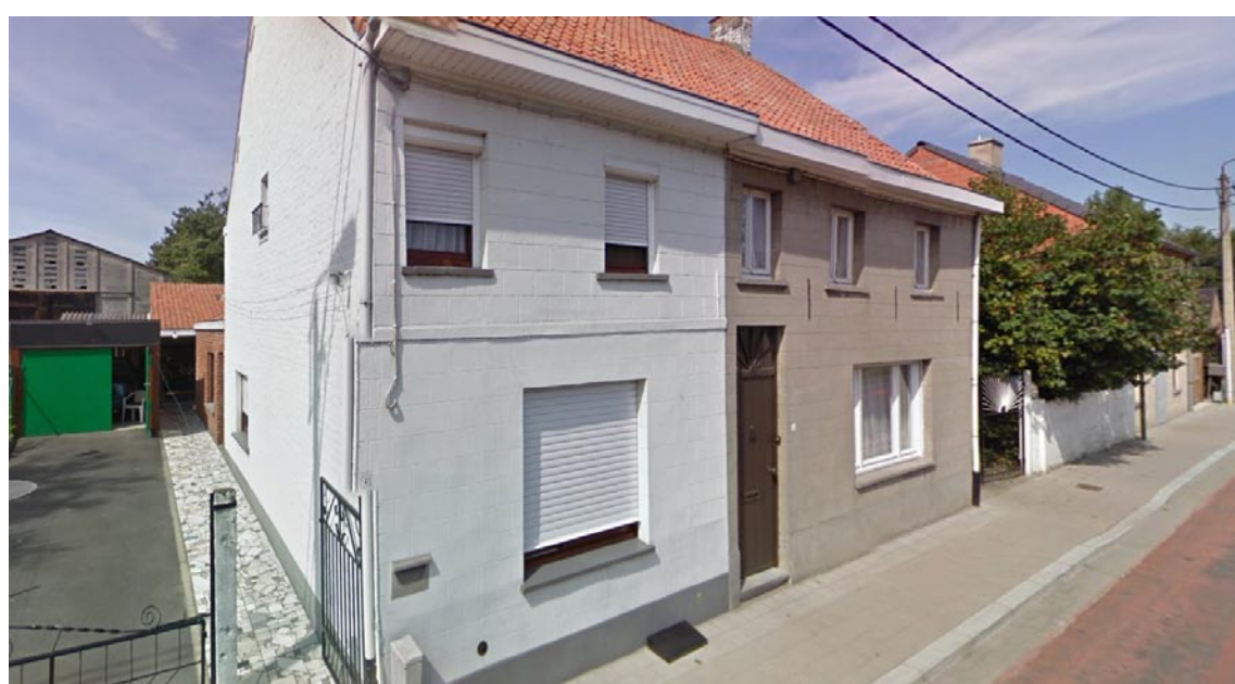
Rechts De Beughels (nu afgebroken) met links ervan het tot woonhuis omgebouwde schuurtje.